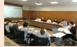
看護連携部会会議

情報共有ツールの見直しと 新たな様式をスタート! 高齢者等に必要ケアは医療と生活の両面にわたるため、病院から在宅への多職種連携がスムーズに進むよう平成31年に入退院マニュアルを作成し、半年間の運用を経て見直しを行いました。また元年度には、地域包括ケアシステムを推進し専門職が多職種間で情報を共有して連携を進めるため、専門職による部会を設置し、それぞれの課題の解決と情報共有ツールについて検討を行い、看護サマリー等新たな様式の運用を始めました。現在設置されている部会について、裏面にご紹介します。